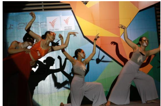
การแสดงของกลุ่มเยาวชนในพิธีเปิด