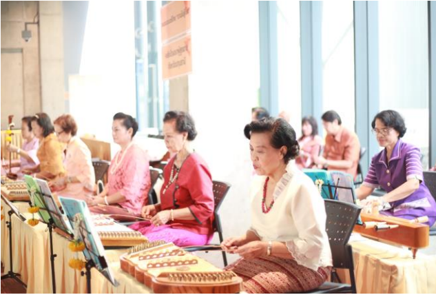
ดนตรีไทย “บ้านไม่รู้โรย” บรรเลงสร้างบรรยากาศในงาน