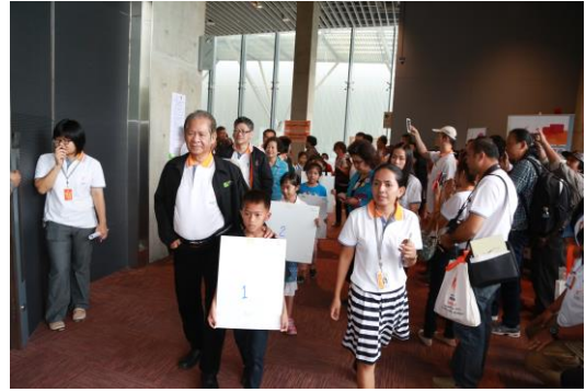
ขบวนประธานเปิดงาน