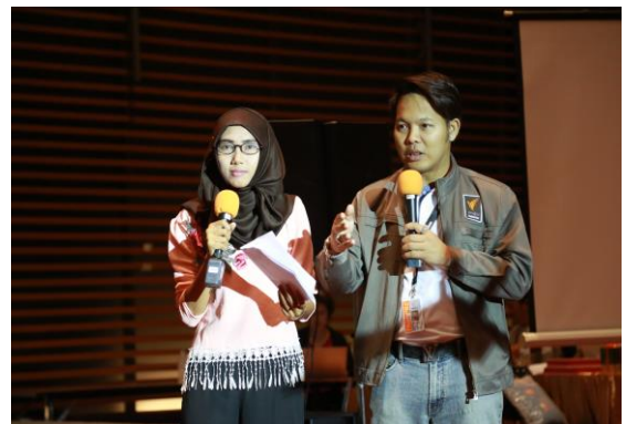
สมาชิกสภารุ่นใหม่เป็นพิธีกรในงาน