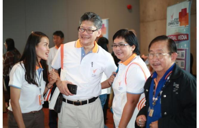
กระทปไหล่ผู้อำนวยการไทยพีบีเอส