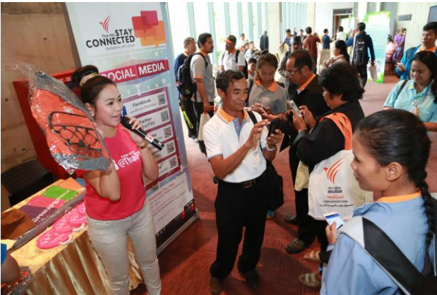
สมาชิกสภาฯ แนะนำกิจกรรม