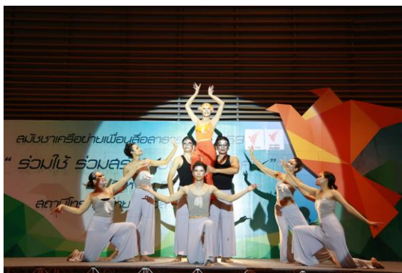
พิธีเปิดสมัชชา