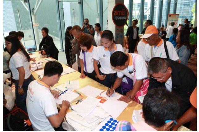
ผู้ร่วมลงทะเบียนมากกว่า 200 คน