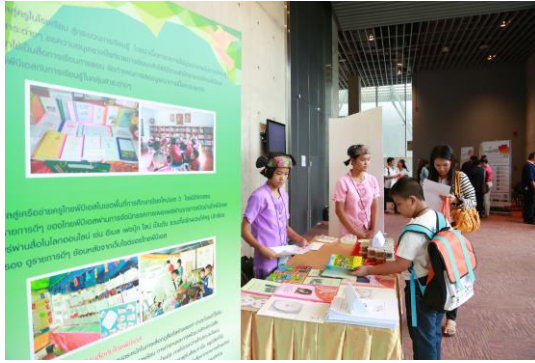
กลุ่มผู้ใช้ประโยชน์จากรายงานของไทยพีบีเอส